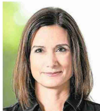
Nationalrätin Maja Riniker, Sprecherin der Sicherheitspolitischen Kommission.